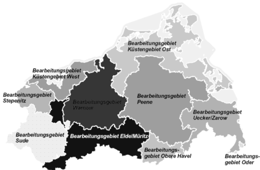
Abbildung 2: Bearbeitungsgebiete WRRL in Mecklenburg-Vorpommern

zugsgebiet wurden bisher drei Berichte (Abgrenzung der Flussgebietseinheit und Zuständigkeiten 2004, Bestandsaufnahme 2005, Überwachungsprogramme 2007) an die Europäische Kommission gesendet. Die Internationale Kommission zum Schutz der Oder vor Verunreinigungen (IKSO) dient bei der Erstellung des Bewirtschaftungsplan bis 2009 als Koordinierungsplattform (Stratenwerth 2007).