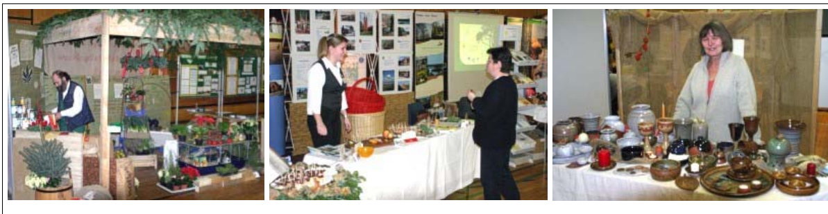
Abbildung 2: Stände auf der 1. Warnow-Regionalschau

Die zweite Regionalschau wird im November 2004 durchgeführt.