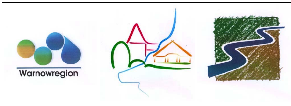
Abbildung 3: Entwürfe aus dem Wettbewerb „Die Warnow braucht ein Logo!“

Im Ideenwettbewerb für ein Logo der Warnowregion erhielten wir 66 Einsendungen von teilweise hoher künstlerischer Qualität. Die Jury wertete in den vier Kategorien Schüler, Studenten, interessierte Laien und Profis. Es gab sehr anspruchsvolle Beiträge. Keiner ist jedoch für eine unmittelbare Nutzung als spezifisches Logo der Warnowregion geeignet. Auf der Grundlage der eingereichten Vorschläge wird bis zum Sommer 2004 das Logo der Region entwickelt. Es soll auch als Herkunfts- und Gütesiegel dienen.