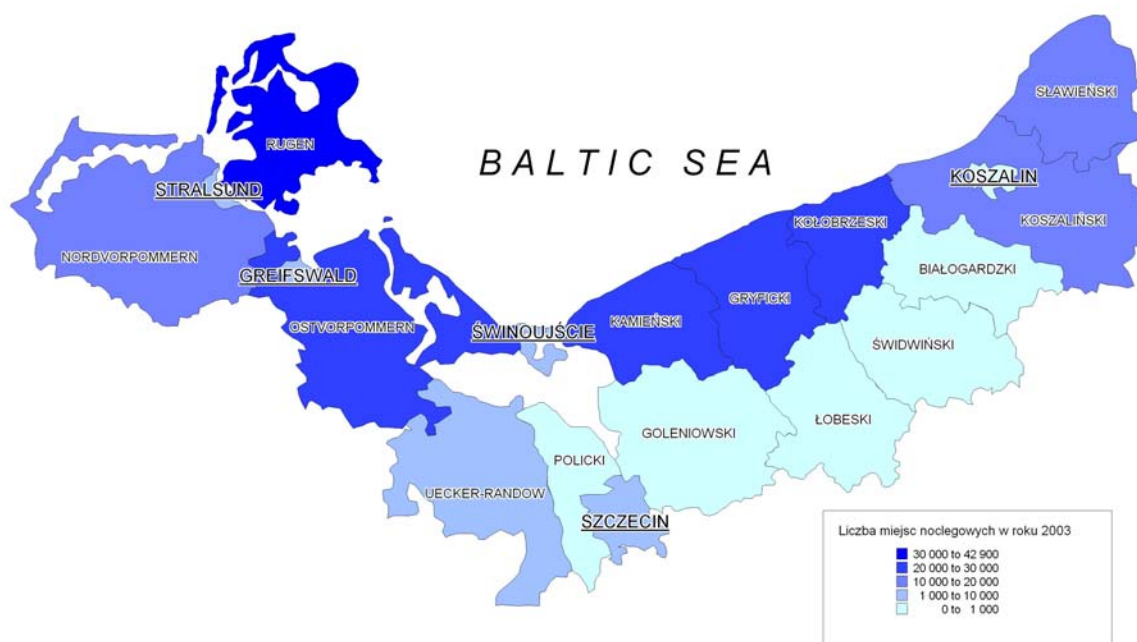
Rys. 1: Miejsca noclegowe na terenie destynacji polsko-niemieckiej w roku 2003